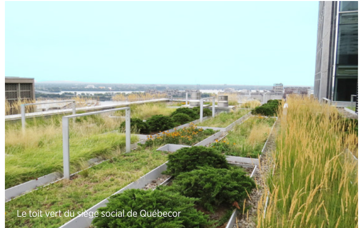
Le toit vert du siège social de Québecor

En 2021, Groupe TVA a poursuivi son projet de potager urbain sur le toit de l'édifice de son siège social, au centre-ville de Montréal, permettant d'accroître la biodiversité dans un quartier densément peuplé de la ville et d'atténuer les effets des îlots de chaleur. L'été dernier, deux ruches se sont ajoutées au projet, contribuant ainsi à la pollinisation du secteur.