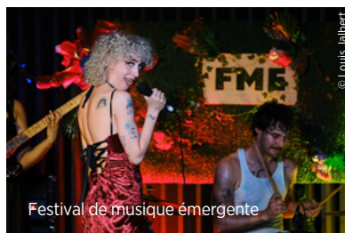
Festival de musique émergente