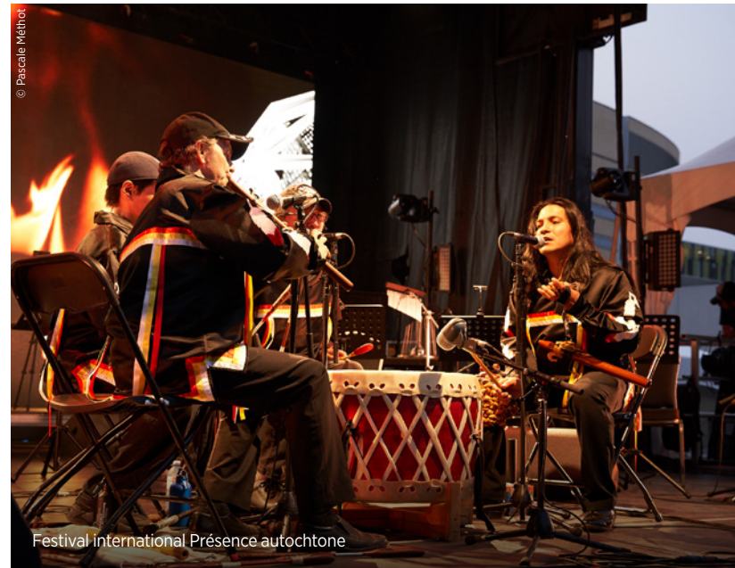
Festival international Présence autochtone