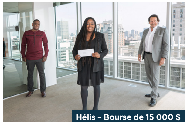
Hélis – Bourse de 15 000 $