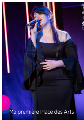
Ma première Place des Arts