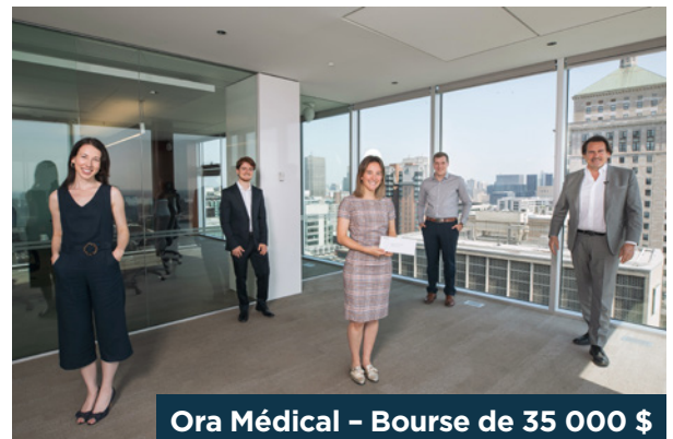
Ora Médical – Bourse de 35 000 $