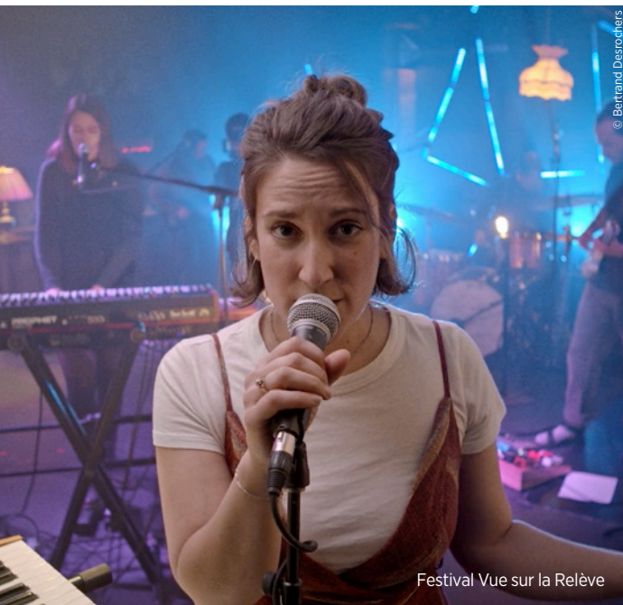
Festival Vue sur la Relève

En nous associant au Réseau intercollégial des activités socioculturelles du Québec, nous soutenons les activités encadrant le Prix littéraire des collégiens, un prix littéraire décerné chaque année par les différents collèges et cégeps du Québec afin de promouvoir la littérature québécoise actuelle auprès des étudiants.