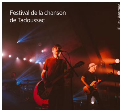
Festival de la chanson de Tadoussac