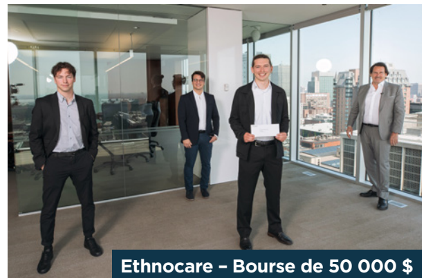
Ethnocare – Bourse de 50 000 $