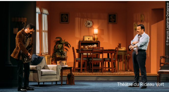
Théâtre du Rideau Vert