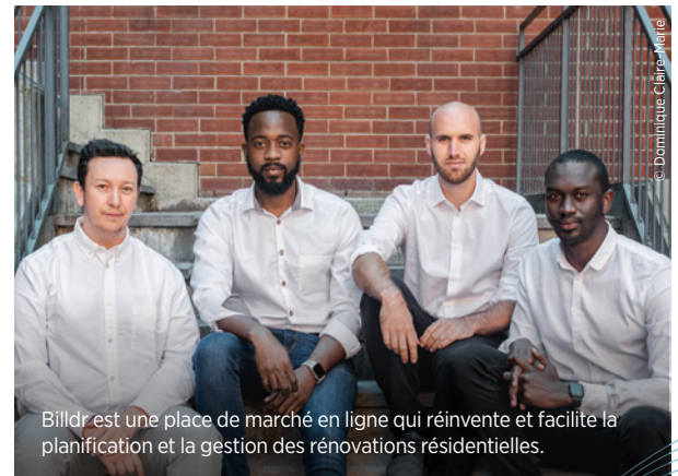
Billdr est une place de marché en ligne qui réinvente et facilite la planification et la gestion des rénovations résidentielles.

Notre expertise en matière de marketing Web et de médias numériques représente pour Billdr un atout important alors que l'entreprise poursuit l'exécution de son plan stratégique et qu'elle maintient un rythme de croissance accéléré.