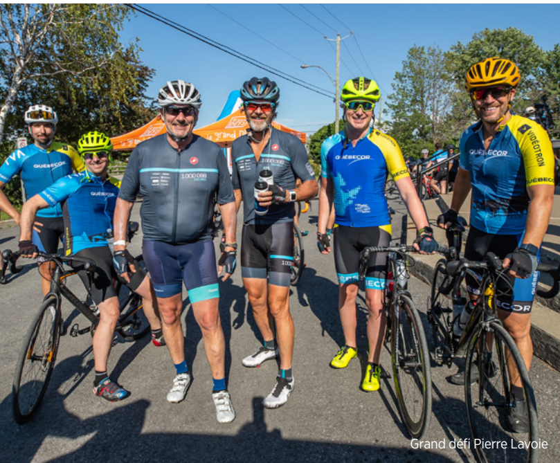
Grand défi Pierre Lavoie

Pour nous, s'investir dans sa communauté, c'est participer activement à l'effort collectif pour une population active et en santé, une jeunesse épanouie et diplômée ainsi qu'une société inclusive, égalitaire et solidaire envers les plus démunis.