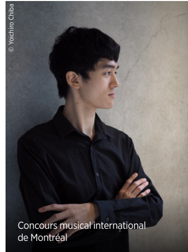
Concours musical international de Montréal