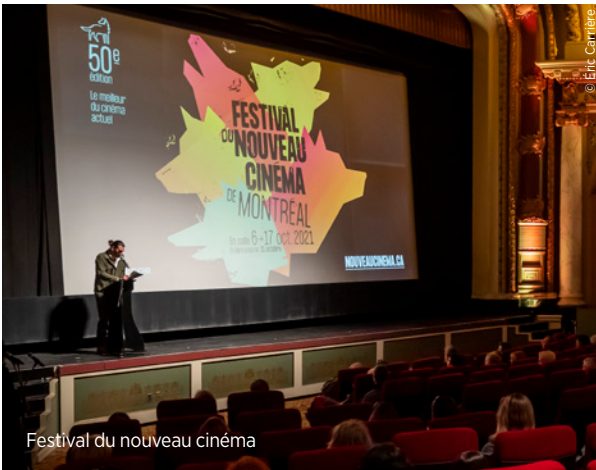
Festival du nouveau cinéma