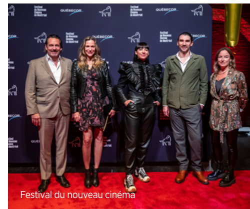
Festival du nouveau cinéma