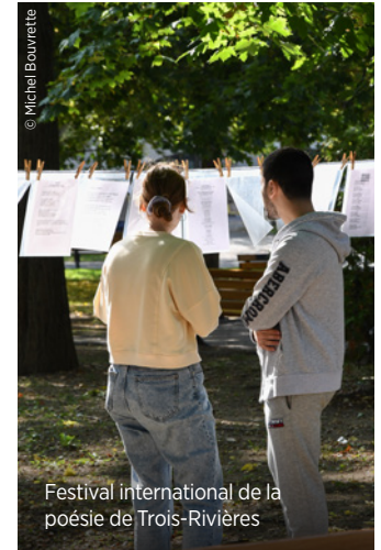
Festival international de la poésie de Trois-Rivières