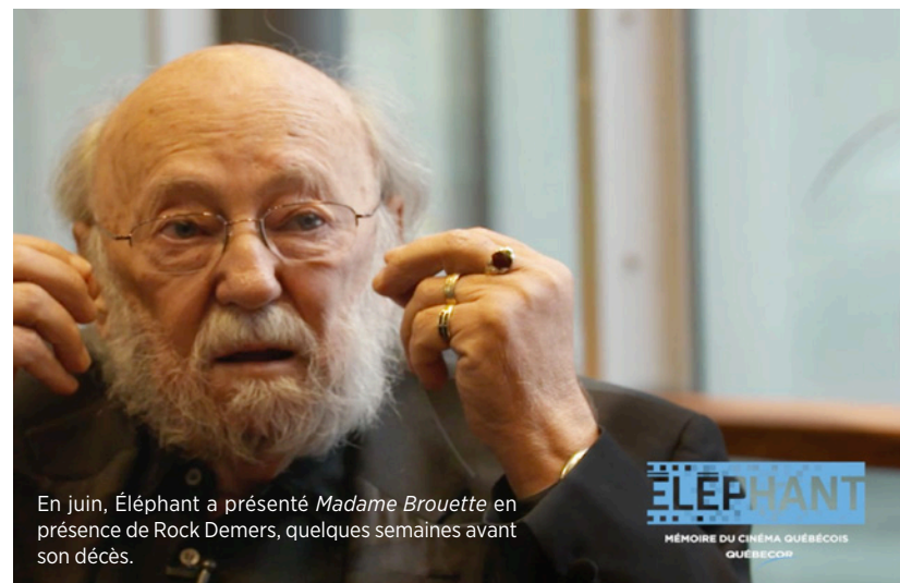
En juin, Éléphant a présenté Madame Brouette en présence de Rock Demers, quelques semaines avant son décès.