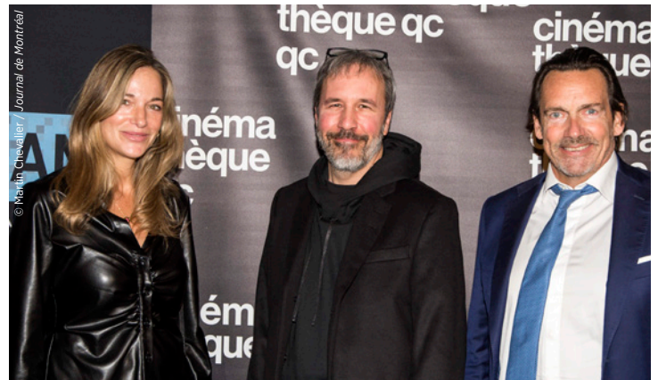
Le 26 octobre, la restauration du deuxième long-métrage de Denis Villeneuve, Maelström , a été projetée devant une salle comble à la Cinémathèque québécoise en présence du réalisateur de renom.

Dès le mois de février 2021, Éléphant a pu reprendre ses projections mensuelles sur grand écran à la Cinémathèque québécoise durant quelques mois, au grand bonheur des cinéphiles. Ce partenariat a permis de présenter 11 films restaurés.