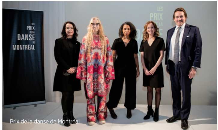
Prix de la danse de Montréal

Ayant à cœur de soutenir la professionnalisation des artistes de la relève, Québecor est partenaire de Vue sur la relève depuis plus de 15 ans et présente la soirée Coups de Pouce, au cours de laquelle une cinquantaine d'intervenants du milieu de la culture, dont MATv et QUB musique, offrent à un participant de leur choix un prix destiné à soutenir le développement de sa carrière. Québecor soutient également directement les artistes en contribuant aux cachets offerts à ces derniers par le Festival.