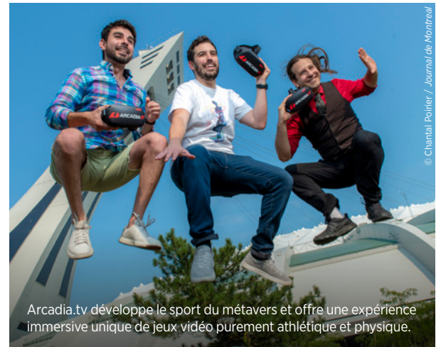
Arcadia.tv développe le sport du métavers et offre une expérience immersive unique de jeux vidéo purement athlétique et physique.

En soutenant Arcadia.tv , Québecor participe concrètement au développement d'une jeune pousse prometteuse qui met la technologie au profit du dépassement de soi ainsi que du bien-être mental comme physique.