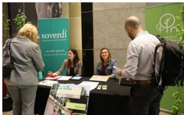
Kiosque d'information animé par des experts de l'entreprise Soverdi, pour encourager la plantation et le bon entretien des arbres à la maison.

Création et entretien de potagers urbains, qui sont mis à la disposition des employés tout au long de la saison estivale, sur quatre sites de Québecor.