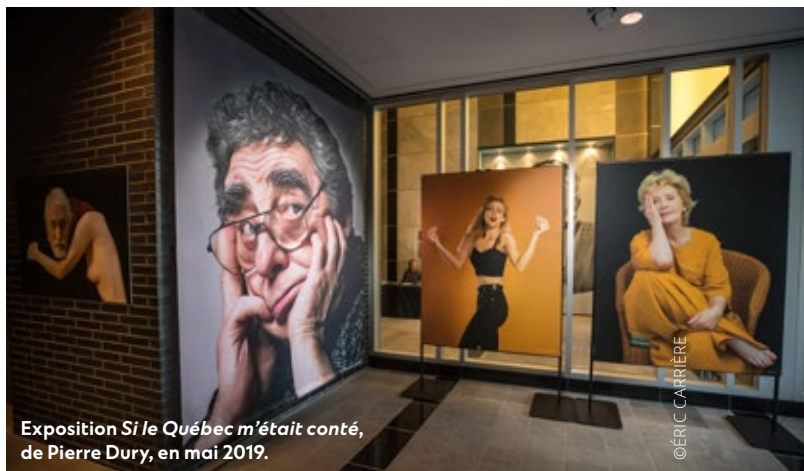
Exposition Si le Québec m'était conté , de Pierre Dury, en mai 2019.

Situé au rez-de-chaussée de son siège social, l'Espace musée Québecor offre aux employés, aux visiteurs ainsi qu'aux passants la possibilité de découvrir et d'apprécier les œuvres d'artistes québécois provenant de tous horizons. L'Espace musée Québecor a accueilli, en 2019, les expositions de trois grands artistes québécois : le peintre Louis Boudreault, l'artiste photographe Pierre Dury ainsi que la peintre et poète Louise Robert.