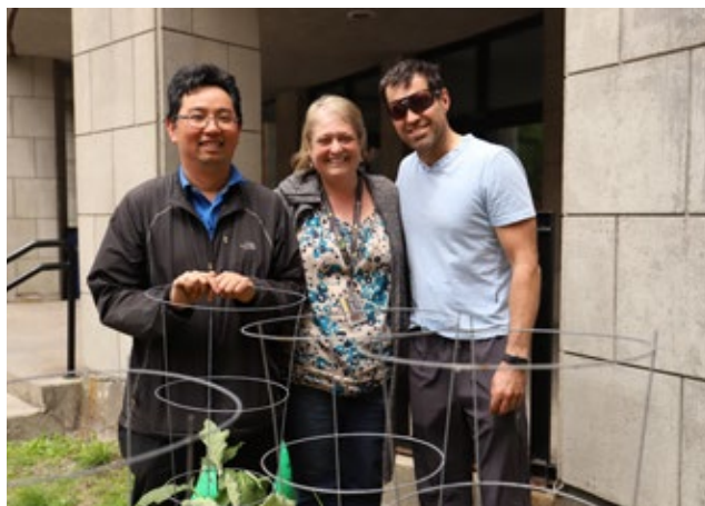
Ateliers sur l'agriculture urbaine proposés aux employés afin de leur faire découvrir tous les bienfaits du jardinage en ville.

En 2019, Québecor et ses filiales ont pu compter sur l'engagement et le dévouement de près de 100 ambassadeurs verts. Ces employés s'impliquent volontairement pour mettre en place des projets et des activités de sensibilisation à l'environnement au sein de leur milieu de travail. Voici quelques exemples des réalisations des ambassadeurs verts de Québecor.