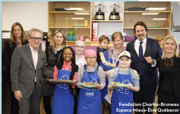
Fondation Charles-Bruneau Espace Mieux-Être Québecor

Voici un survol de quelques-uns des partenariats de Québecor, aux quatre coins du Québec!