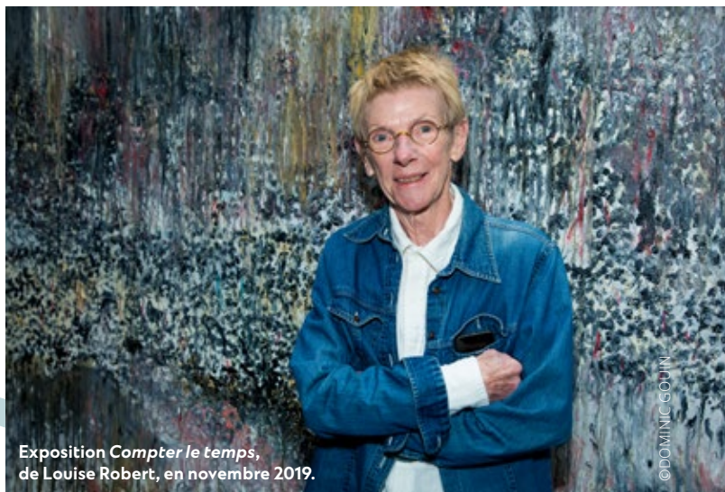
Exposition Compter le temps , de Louise Robert, en novembre 2019.