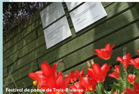
Festival de poésie de Trois-Rivières